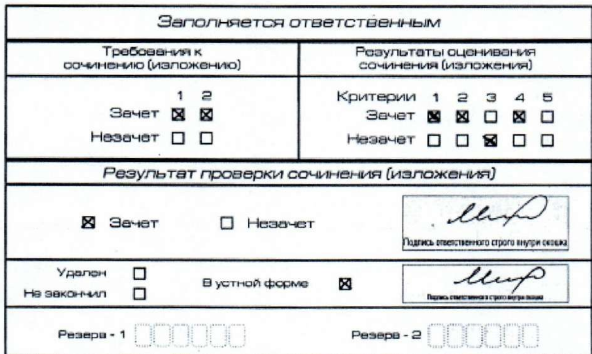
Рис. 12. Область для оценки работы сочинения (изложения) в устной форме

После окончания заполнения бланка регистрации ответственное лицо ставит свою подпись в специально отведенном для этого поле.